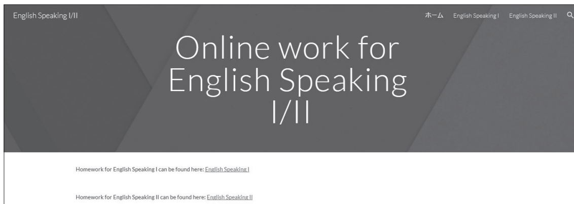
図 3：Google Sites で作成した簡易的ウェブページ（フロントページ）