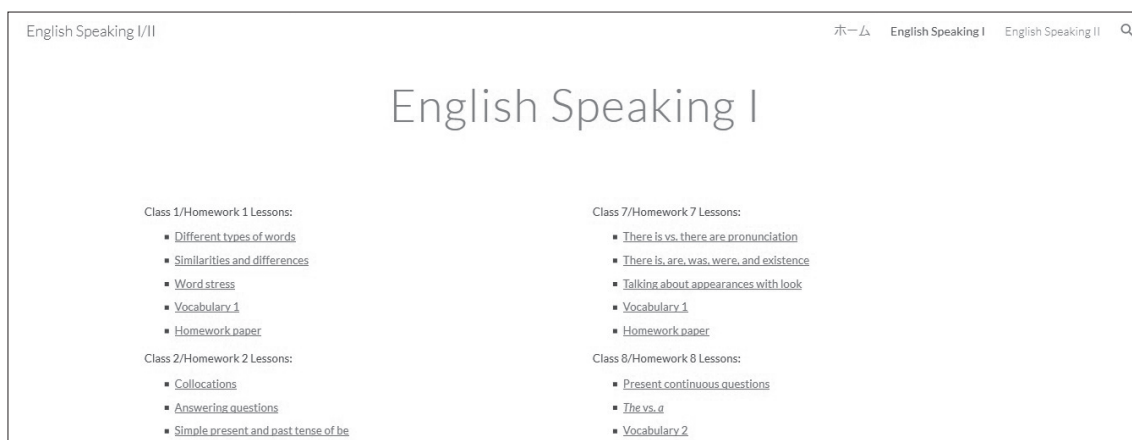
図 4：Google Sites で作成した簡易的ウェブページ（課題のリスト）

うことにはつながらず、反転授業には該当しない。上記を踏まえ、手間がかかるとはいえ、個人で作成した方が、利点が多いと思われる。ことに追加説明が必要なポイントが出ると、適宜に作成でき、問題が生じたときは、すぐに対応できる。また、将来的に、他の教員にもシェアすることも可能である。最後に、重点点ではあるが、教科書が変わっても、著作権は個人にあるため使い続けられ、長期的な学習計画につながる。